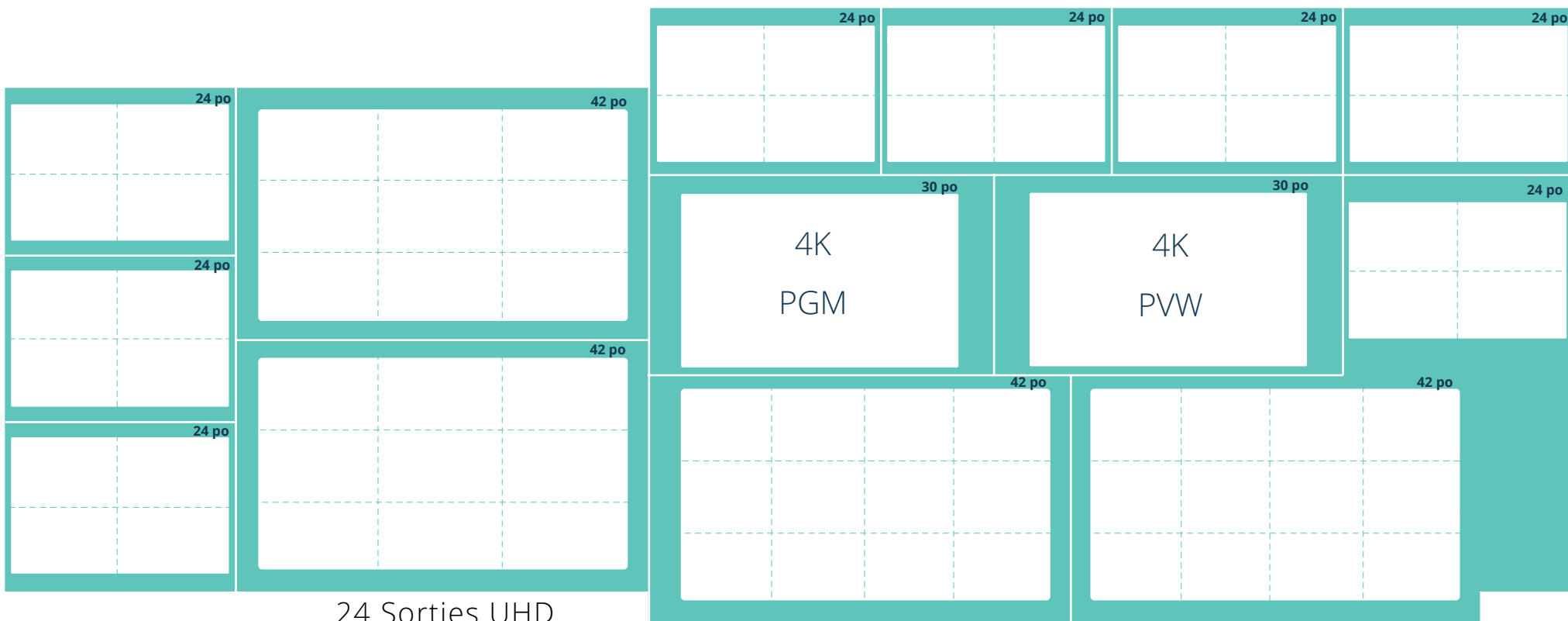
24 Sorties UHD